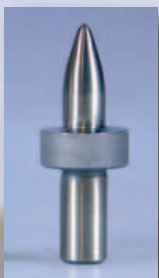
Lang (mit Kragen)