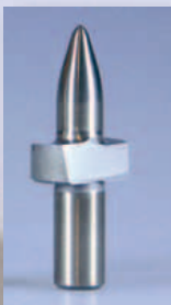
Lang/flach (ohne Kragen)